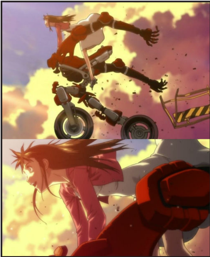
climax van de op hol geslagen FUEGO

op de tv zijn de aanslagen en hun strijd tegen de GGP te volgen. Deze aanslagen nemen steeds drastischere vormen aan en de BMA gebruikt zelfs Ridebacks als wapens in hun strijd. In een latere aflevering komt Shouko (de vriendin van Rin) midden in een aanslag terecht. Rin snelt haar te hulp met Fuego, maar door de chaos wordt ze als terrorist gezien.