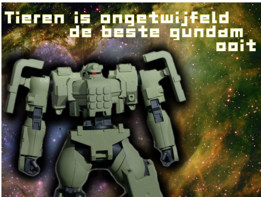
Not yet finished Tieren MSJ-06II-A